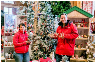
Der Weihnachtsmarkt im Tierparadies auf Gut Aiderbichl ist heuer nur virtuell zu erleben. Mit dem Einkauf unterstützt man die Versorgung der insgesamt 6000 getreteten Tiere.

Für die Besucher stehen auf dem virtuellen Tierparadies-Rundgang liebevoll hergestellte Weihnachtsdekorationen, Zierprodukte oder auch Tiere aus Porzellan bereit. Damit kann jeder seine Weihnachtsdeko für Zuhause bestellen und gleichzeitig den Tieren auf Gut Aiderbichl helfen, die dringend Unterstützung benötigen.